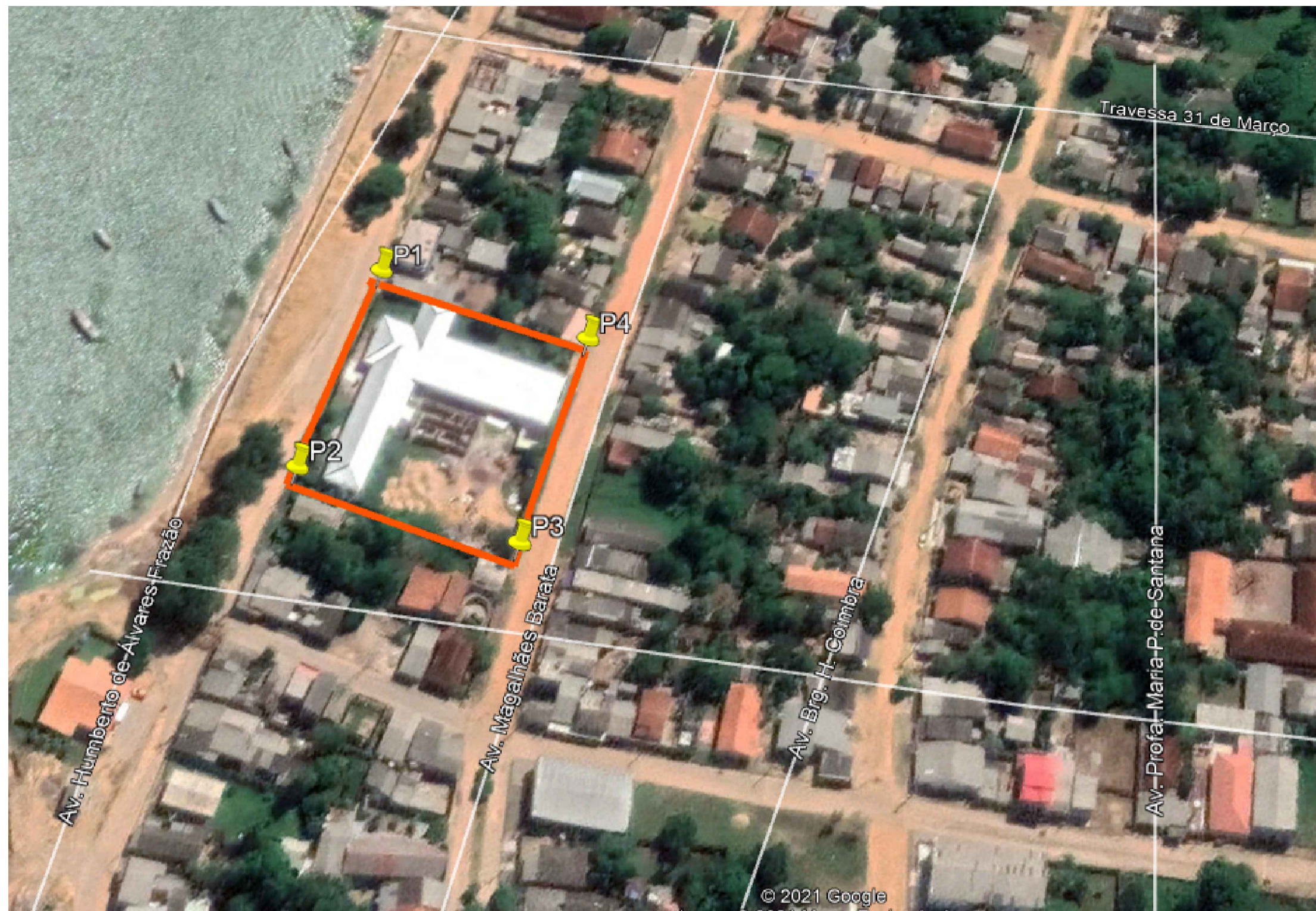
Mapa de Situação S/ Escala