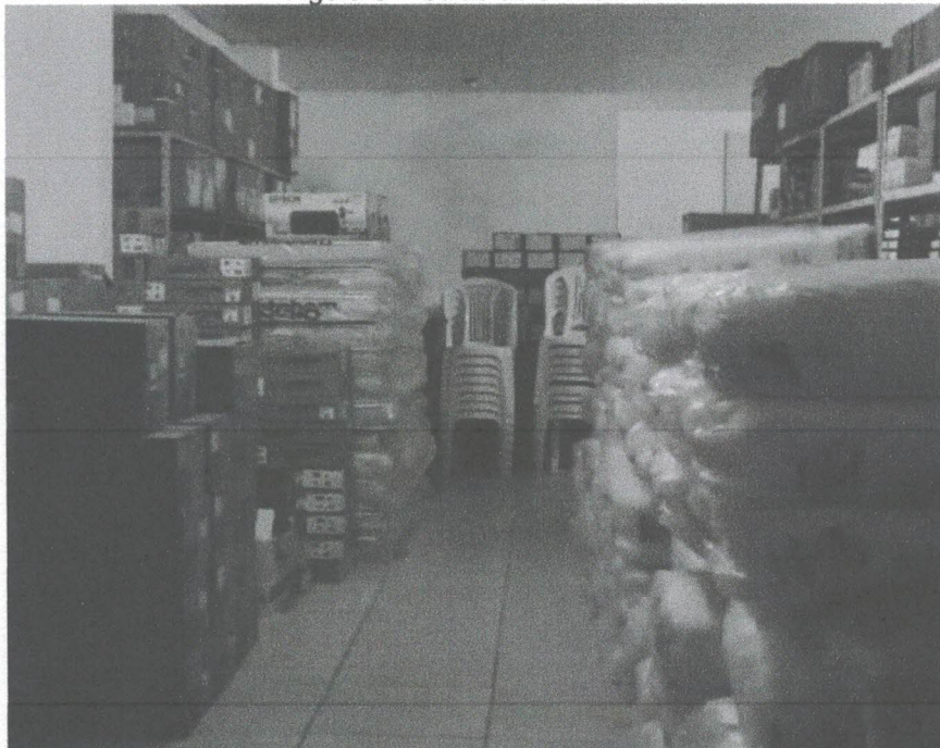
Figura 3 – Salas de atendimento

CNPJ: 04.542.916/000124 | AV HUMBERTO DE ABREU FRAZÃO, S/N, CENTRO - AVEIRO - PARÁ | CEP. 68.150-000 www.aveiro.pa.gov.br | licitapmaveiro@gmail.com