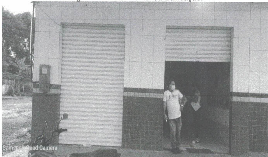
Figura 1 – Vista Frontal da Edificação.